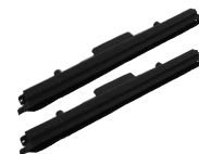
• 6.505.0001 Gumy ściągające